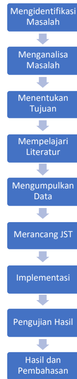
Gambar 1 Kerangka Kerja Penelitian

Kerangka kerja penelitian yang dilakukan pada penelitian ini, dapat dilihat pada Gambar 1.